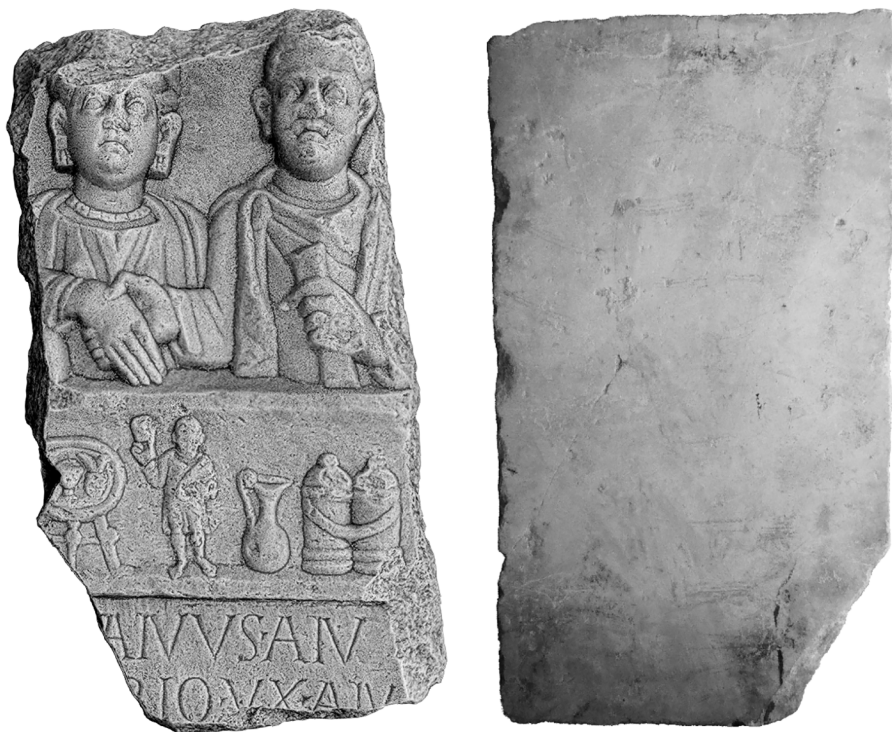
1. ábra: A pécsváradi sztélé-töredék elő- és hátulnézetben 15

A jobb és bal oldalon, alul és felül egyaránt töredékes darab legnagyobb magassága 75 cm, legnagyobb szélessége 39 cm, vastagsága 19 cm. Anyaga fehér márvány. 14 Hátoldalát simára csiszolták. A sztélé építőanyagként történő újrahasznosításakor a darabolást rendkívül gondosan végezték el, a csonka darab hátoldalának élszögei derékszögek. Következésképpen a hátlap esztétikus kialakítását tartották szem előtt a „ spolia -képzés” során (1. ábra).