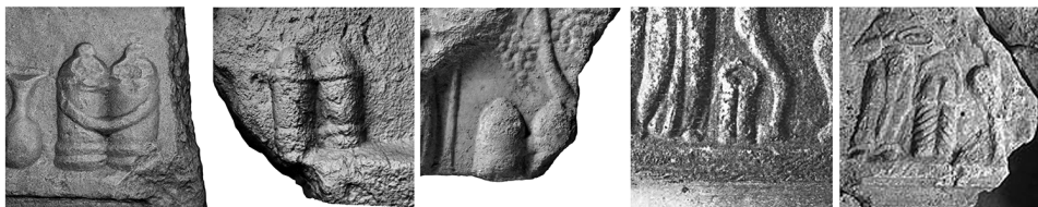
3. ábra: A mensa tripes mellett ábrázolt tárgyak a pécsváradi, valamint a Lupa 641, 5295, 3781, 5997 emlékeken 40

A korsótól jobbra két hengeres tárgy, magasságuk a férfi vállvonaláig ér. Két talpgyűrűvel és egy nyakgyűrűvel rendelkeznek. A hengereket kónikus fedők zárják, amelyek egy-egy ki-sebb kúpban végződnek. A szorosán érintkező hengereket a nyakgyűrűk alatt rögzített fo-gantyú köti össze. Pannoniában a pécsváradi sztélé ábrázolásával megegyező tárgyakat ta-lálunk a mensa tripes mellett egy Velika Nedelja-i, valamint egy Zgornja Hajdina-i szarko-fágon, két pécsi és egy esztergomi sírsztélén (3. ábra). 39