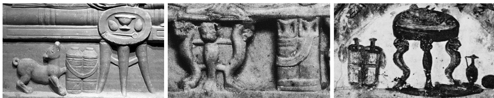
4. ábra: Kettős kosárüveg a mensa tripes mellett egy beiruti és egy Porto Torres-i szarkofágon, valamint a Szent Péter és Szent Marcellinus-katakomba egyik festményén 55

meghatározásuk meglehetősen ellentmondásos, felmerült a fűzfakosár, 42 a szalmaedény, 43 a kettős edény, 44 a kettős lámpás, 45 az oltár, 46 a cippus , 47 a világítótornyocska, 48 a kerek szék 49 és a kettős kosárüveg 50 . Véleményem szerint az utóbbiról van szó, ami alátámasztható a birodalom egyéb területein előkerült, részletgazdagabb ábrázolásokkal. 51 Különösen beszédesek azok a jelenetek, amelyekben fedél nélkül látható a kettős kosárüveg, így kilátszik az üvegpalcok szája (4. ábra / II–III). Tartalmukat illetően Katherine M. D. Dunbabin borra, 52 Bojan Djurić borra és vízre gondolt, 53 míg Rita Amedick szerint aromákat tartalmaztak, amik a palackok kinyitásakor kellemes illatot árasztottak. 54