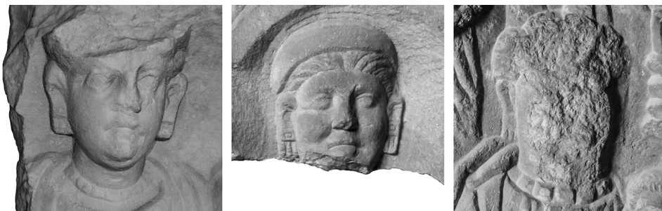
2. ábra: A pécsváradi, valamint a pécsi Lupa 645 és 650 sírsztélék portréi 27

A férfi haja rövid, orra leverve. Mandulavágású szemei nyitottak, szemhéjai látszanak, de a pupilla és az írisz nincs kidolgozva, ezek legfeljebb festve lehettek. Rövid szakállt és bajuszt visel. A felső ajkát a bajusz eltakarja, alsó ajka lefelé görbül. Ruházata tunica manicata és köpeny ( sagum ), az utóbbit a jobb vállán korongfíbula tartja, a bal vállra pedig vissza van hajtvva. 28 Bal kezében zárt irattekercset ( volumen ) tart. A tekercs egy columnából áll, 29 a tekercstartónyélnék ( umbilicus ) nincs nyoma. 30 A tekercset tartó bal kezének mutatóujja kinyújtva. 31 A bal kézfej sérülése miatt a gyűrűviselés tényét nem lehet megállapítani.